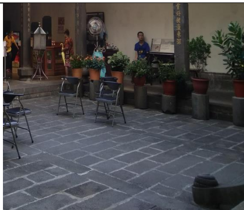
龍山寺中庭石材為觀音山石