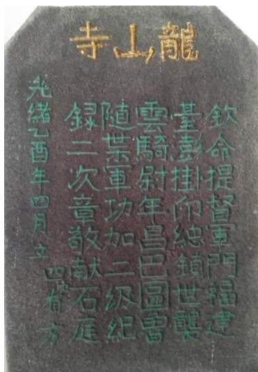
清朝抗法名將章高元捐獻 龍山寺中庭石材勒名石碑