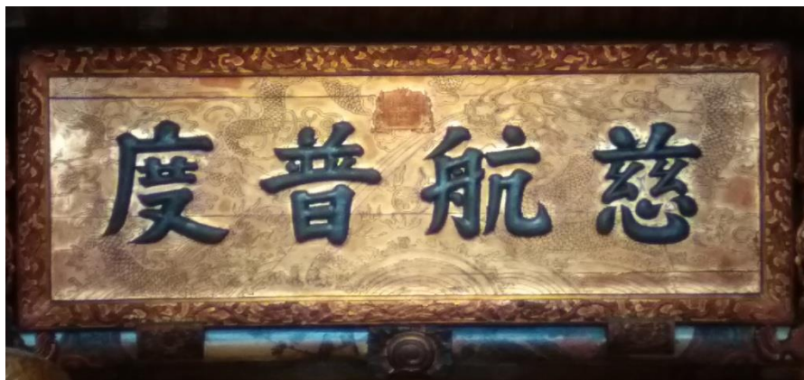
清法戰爭後，光緒十二年(1886)清廷頒賜「慈航普度」匾額