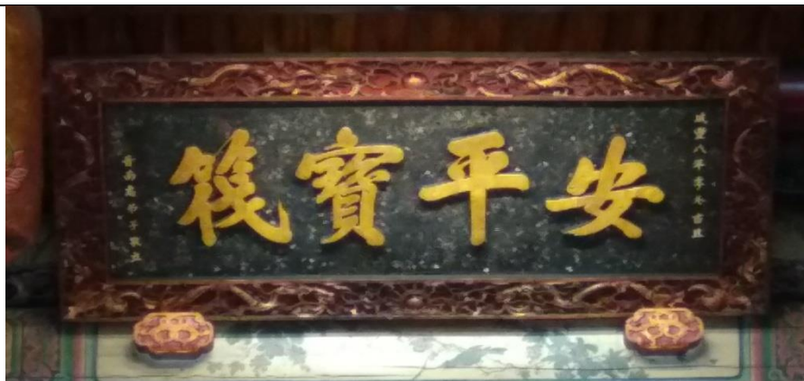
咸豐八年（1858）三邑弟子所立的匾額