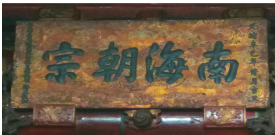
光緒七年（1881）鑲藍協領得 泉敬獻的匾額