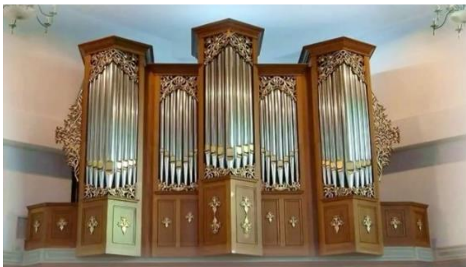
真耶穌教會五樓主會堂的管風琴

尖塔，內外牆用陶磚和砂石岩，主會堂尖拱高挑及四周為彩繪玻璃窗。以「百合花」作為教會的精神象徵：一樓入口、主會堂、管風琴、講台均有百合花圖案。主建築包括：地下二樓地上五樓；地下室為停車場及餐廳、宗教教育教室，一至四樓分別為副堂、教室辦公室、學生中心、圖書館，五樓為主會堂。